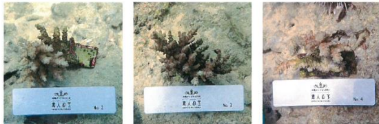
移植したサンゴの苗

また、この活動にご参加頂いた代理店皆様、一般ユーザー様に、深く感謝致します。ありがとうございました。